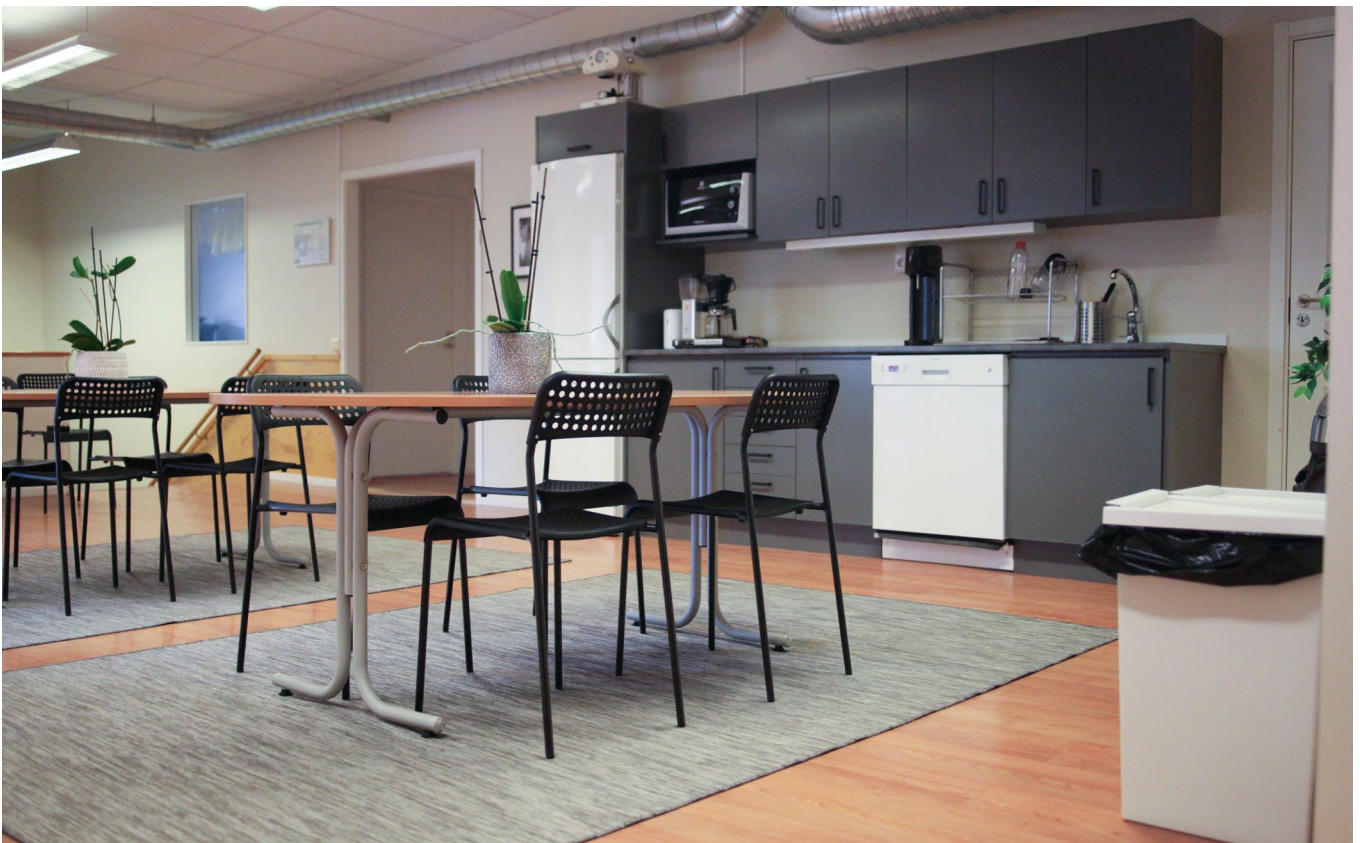
Bild på det aktuella rummet saknas.. Bild 2 används som referens från ett rum bredvid.