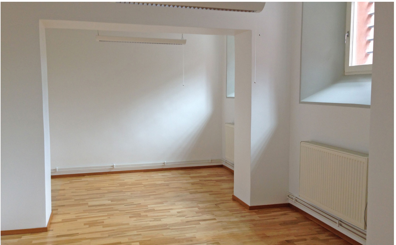
Konferensrum, pentry och kontorsrummet.