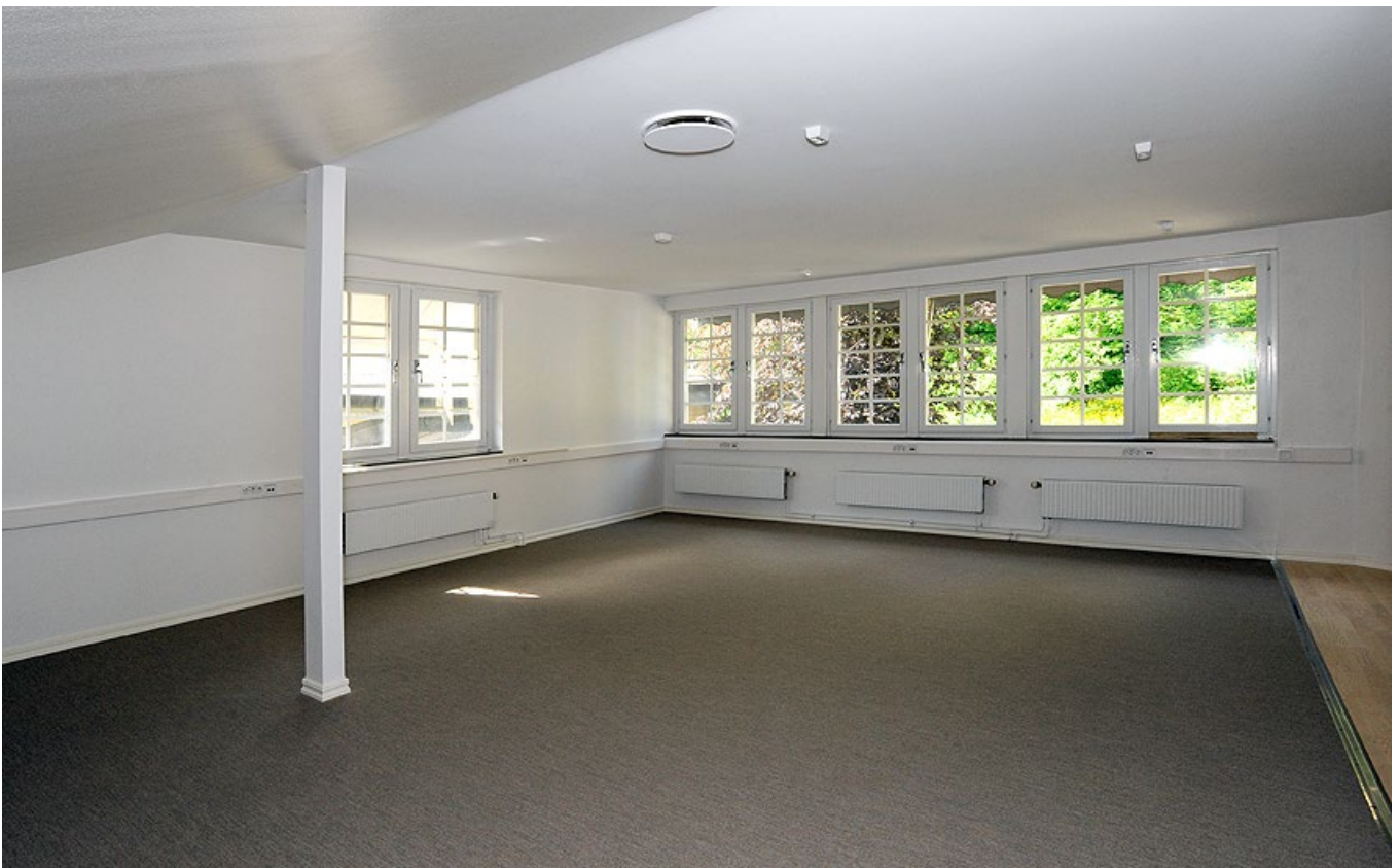
Pentry, förråd och öppen kontorsyta.