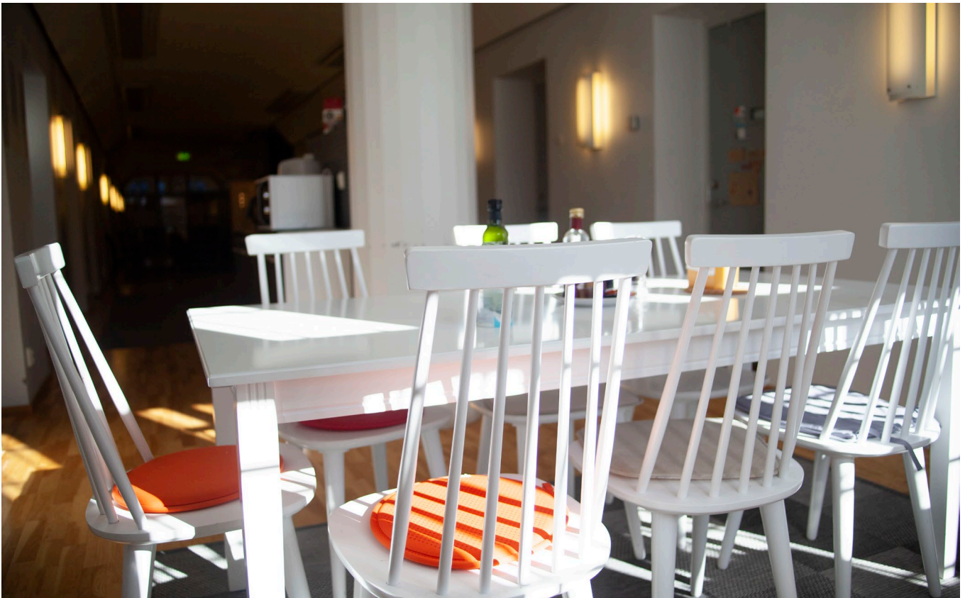
Konferensrum och pentry.